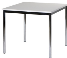
Art. 21001/21002 Meeting table white or black 80x80 21,00 €