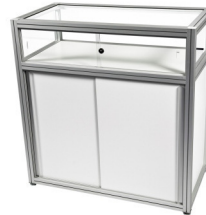
Art. 50111 Table glass cabinet 111,70 €