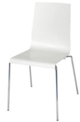
Art. 12680 Chair Kuadra 9,60 €