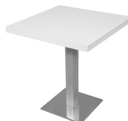
Art. 26120/26125 Bistro table stainless steel wh/bl 39,20 €