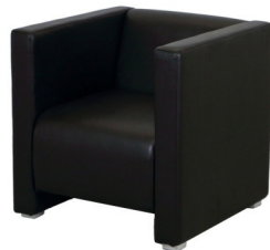
Art. 15015/15016 Armchair Qubo white or black 78,40 €