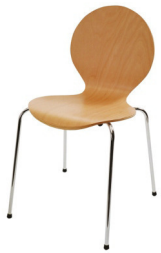
Art. 12030 Chair Balloon beech 11,80 €