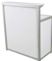
Art. 42305 Counter with composition 64,50 €