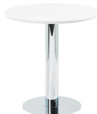
Art. 26000/26010 Bistro table chrome/wh or bl 19,00 € / 20,50 €