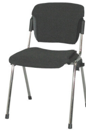
Art. 10261 Chair Flou anthracite 12,00 €