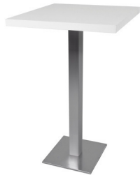
Art. 29120/29125 High table stainless steel w or b 47,20 €