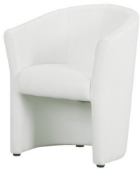
Art. 15000/15100 Club armchair black or white 40,90 €