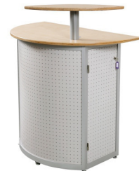
Art. 50631 Computer high desk 122,00 €