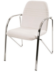
Art. 15604 Conference armchair 23,00 €