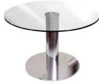
Art. 27050 Coffee table chrome/glass 42,90 €