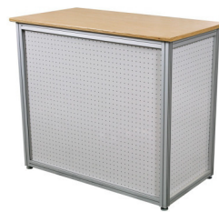
Art. 42451 Counter Magic 108,00 €