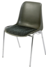
Art. 10130 Shell chair cushioned 7,10 €