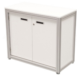
Art. 50020/50018 Sideboard white or black 45,90 €