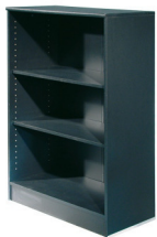
Art. 50206/50207 Filing shelf wh or bl, H 110 19,30 €