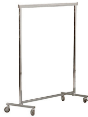
Art. 30001 Wardrobe rack chrome 21,00 €