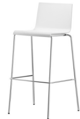
Art. 16680 Bar stool Kuadra white 18,90 €