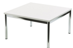
Art. 21081 Coffee table chrome/white 21,00 €