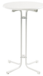
Art. 29010 High table white, foldable 19,30 €