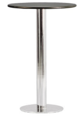
Art. 29080/29090 High table chrome/wh or bl 29,80 € / 32,00 €