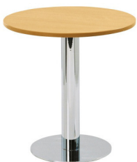
Art. 22104 Bistro table chrome/beechn 25,00 €