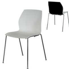
Art. 12112/12113 Chair Kalea wh/bl or wh/red 18,40 €