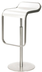
Art. 16022 Bar stool LEM white 54,40 €