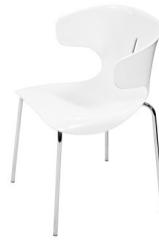
Art. 12070 Chair Vanilla 28,80 €