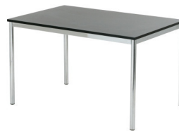
Art. 21021/21022 Meeting table white or black 120x80 23,50 €