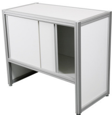
Art. 42295 Counter 53,55 €